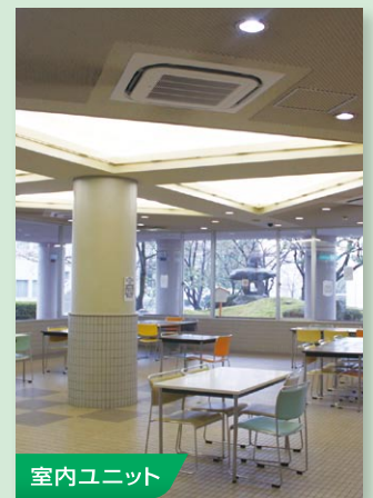
室内ユニット ラウンドフロータイプ(ピロティアーに設置)