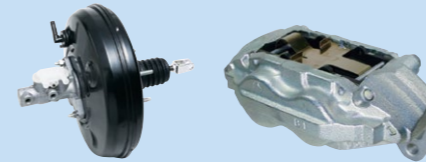
ブレーキブースター付きマスターシリンダー

ADVICS South Africa (Pty) Ltd.がブレーキ部品の生産を開始