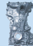
TCC付きオイルポンプ

Aisin Automotive Karnataka Pvt. Ltd. がタタにエンジン部品の納入を開始