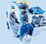
オートマチックトランスミッション