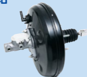
ブレーキブースター付きマスターシリンダー

ADVICS Automotiva Latin America Ltda.がブレーキ部品の現地生産を開始